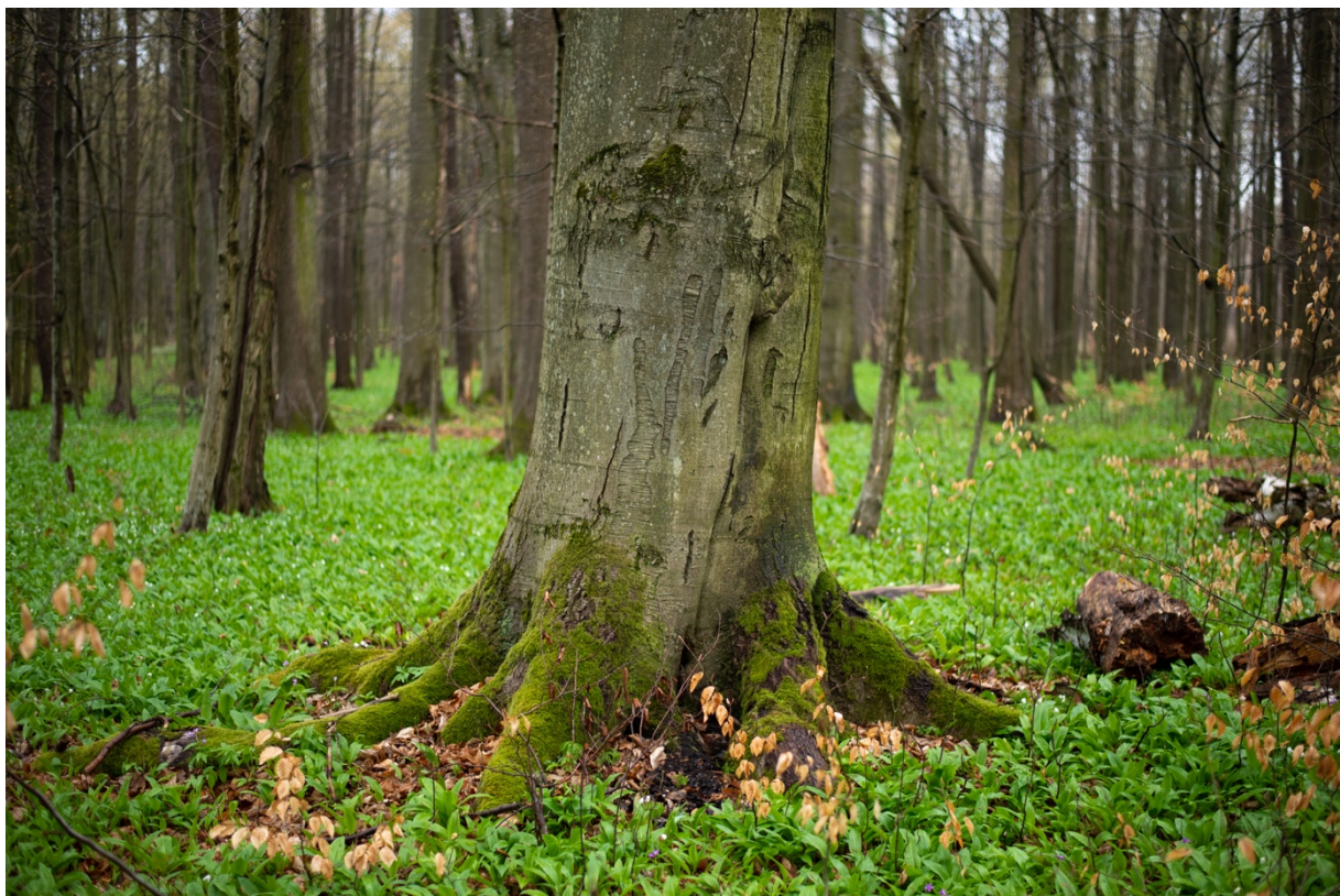
Fot. 1. Jeden z buków o wymiarach pomnikowych.